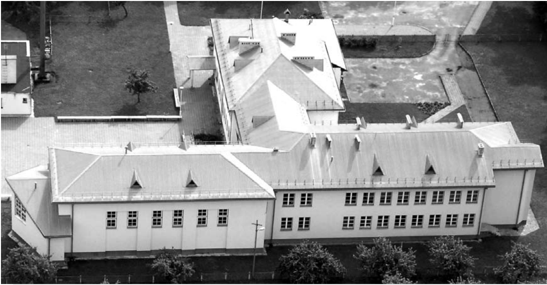
Paskutinė, jau Nepriklausomybės metais pastatyta Anykščių rajono mokykla – Raguvėlės pradinio ugdymo skyrius – pagal ploto, tenkančio vienam mokiniui, santykį gali pretenduoti į Lietuvos rekordų knygą. Vienam mokiniui tenka 187 kv.m pastato ploto arba 3–4 standartiniai butai.

Viešai paskelbtas Anykščių rajono mokyklų tinklo 2016–2020 metais pertvarkos planas. Pertvarkos planai ir „optimizavimai“ visuomet buvo mirties nuosprendis bent kelioms mažiausiomis mokykloms, tačiau naujausias planas išskirtinai kilnus – iki 2020-ųjų žadama palikti visas dabar veikiančias rajono mokyklas.