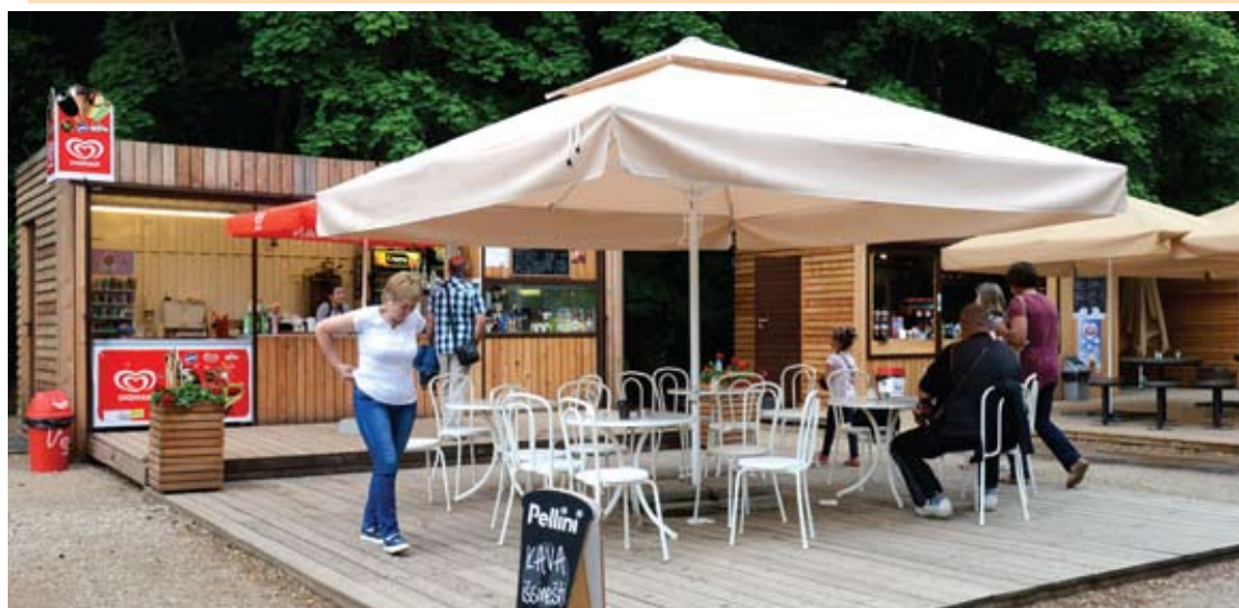
Darbo dienomis lauko kavinukėse tuštoka.