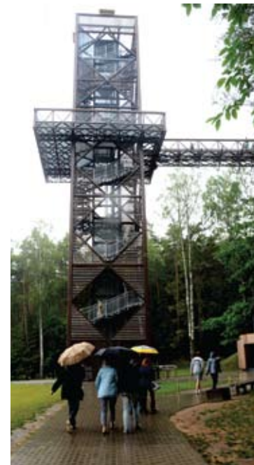
Lajų take žmonių nestinga ir per lietų.