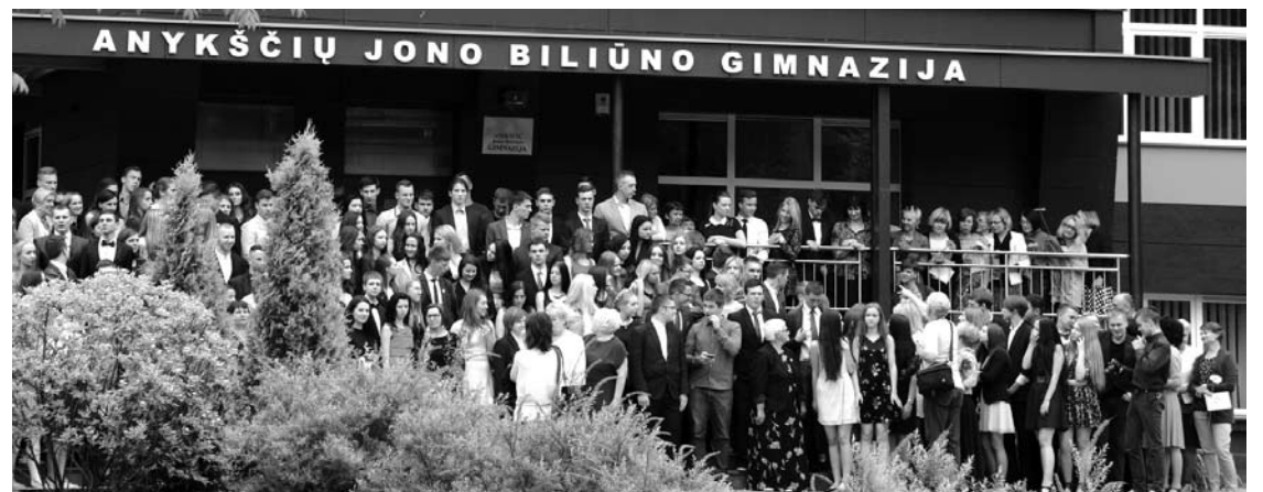
Šiemet iš Anykščių rajono mokyklų išeina 212 abiturientų o juos rugsėjį pakeis 138 pirmokai.

2015 metais į universitetus ir kolegijas įstojo 59,1 proc. Anykščių abiturientų, 2014 m. - 65,6 proc.; 2013 m. - 63,4 proc. Net 17 procentų pernykščių Anykščių rajono abiturientų iš karto po vidurinės mokyklos baigimo išėjo dirbti, o 4,3 proc. (10 asmenų) - nei dirbo, nei mokėsi.